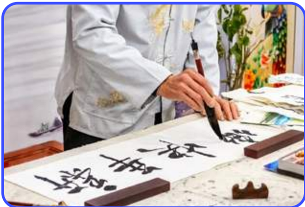
МК ПО КИТАЙСКОЙ КАЛЛИГРАФИИ