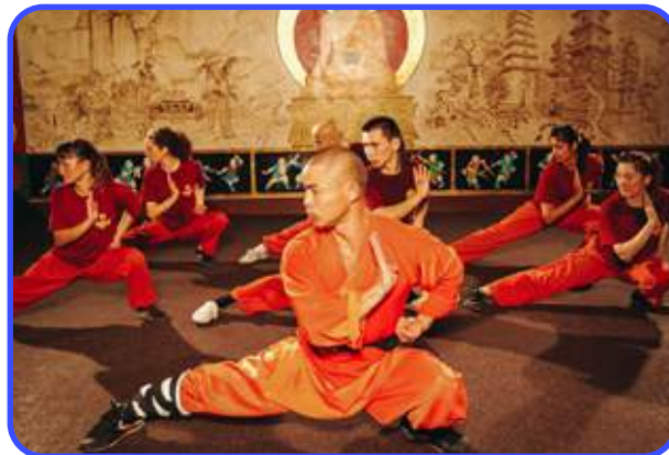
МК ПО УШУ