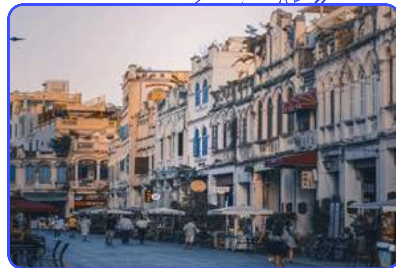
СТАРАЯ УЛИЦА ХАЙКОУ