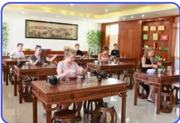
МК ПО ЧАЙНОЙ ЦЕРЕМОНИИ