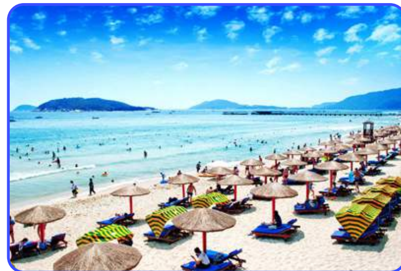
ПЛЯЖИ ОСТРОВА ХАЙНАНЬ

И МНОГОЕ ДРУГОЕ, ЧТО ВАМ ПРЕДСТОИТ УВИДЕТЬ СВОИМИ ГЛАЗАМИ