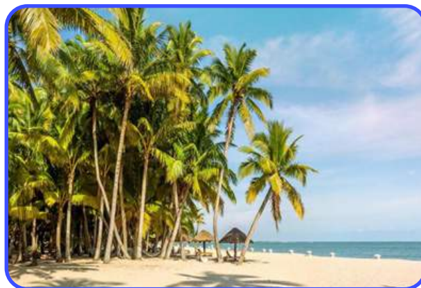
ПАЛЬМОВАЯ РОЩА В Г.ВЭНЬЧАН